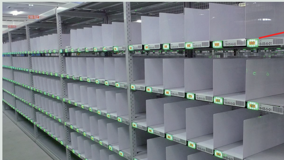
(部品棚への設置例:TK-811+取付けアルミレール使用)

組立部品集品作業をデジタル化！！ 応援者の即戦力化・多品種少ロット生産の効率化に効果大！